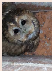
Sauvetage d'une chouette hulotte coincée dans un conduit de cheminée, en 2016, par David Martin.

Si l'animal semble blessé ou trop affaibli pour s'envoler, il est nécessaire de le confier au centre de sauvegarde de la faune sauvage le plus proche. Placez l'oiseau dans un carton perforé et tapissé de journaux ou essuie-tout, puis contactez le centre de soins qui vous indiquera les démarches à suivre.